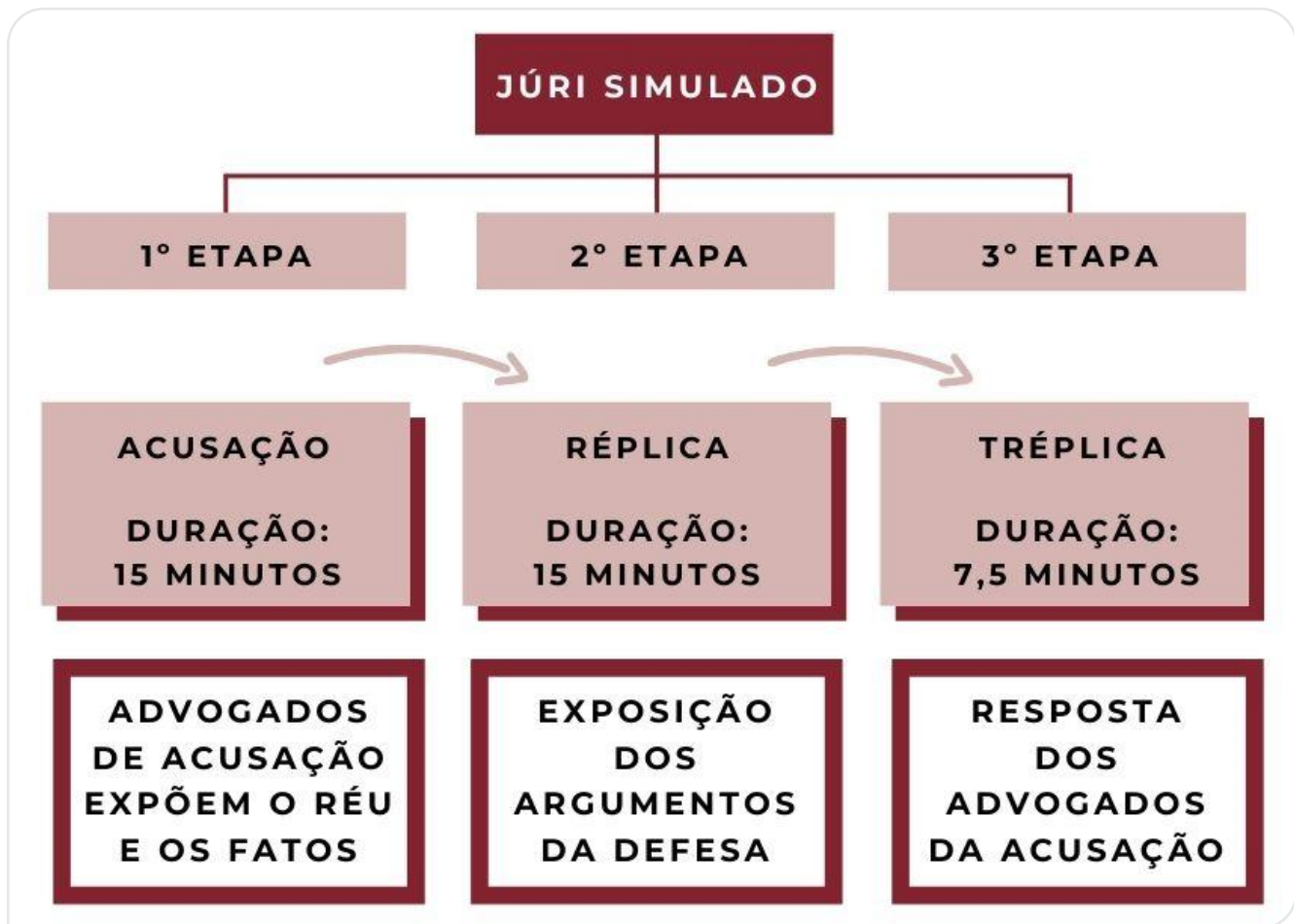
Figura 2. Fluxograma contendo a estrutura e organização do júri simulado em etapas.

metade do tempo inicial para tréplica em resposta à defesa. Após o júri, o momento de culminância encerrou as ações referentes ao componente curricular.